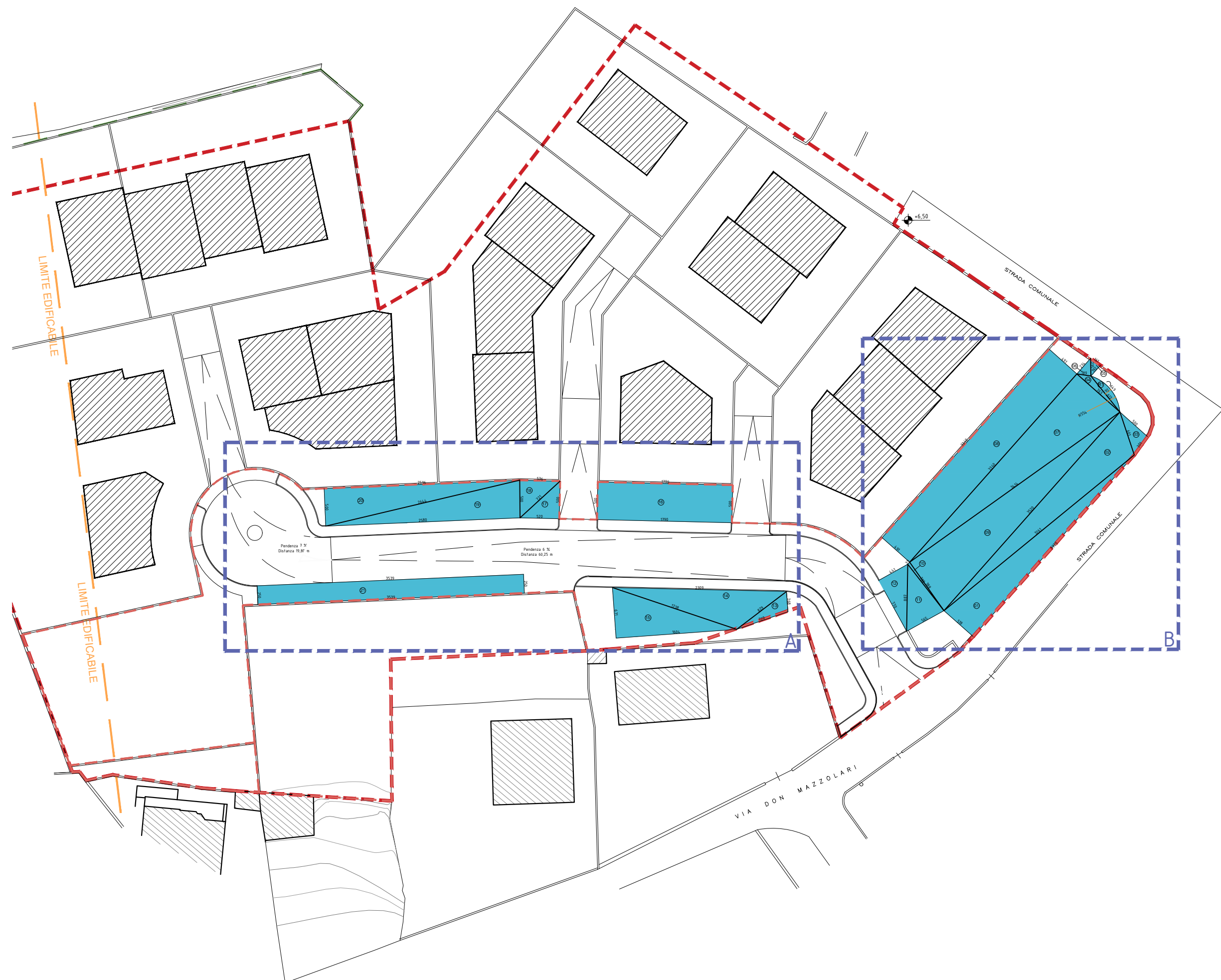
Superficie a parcheggio