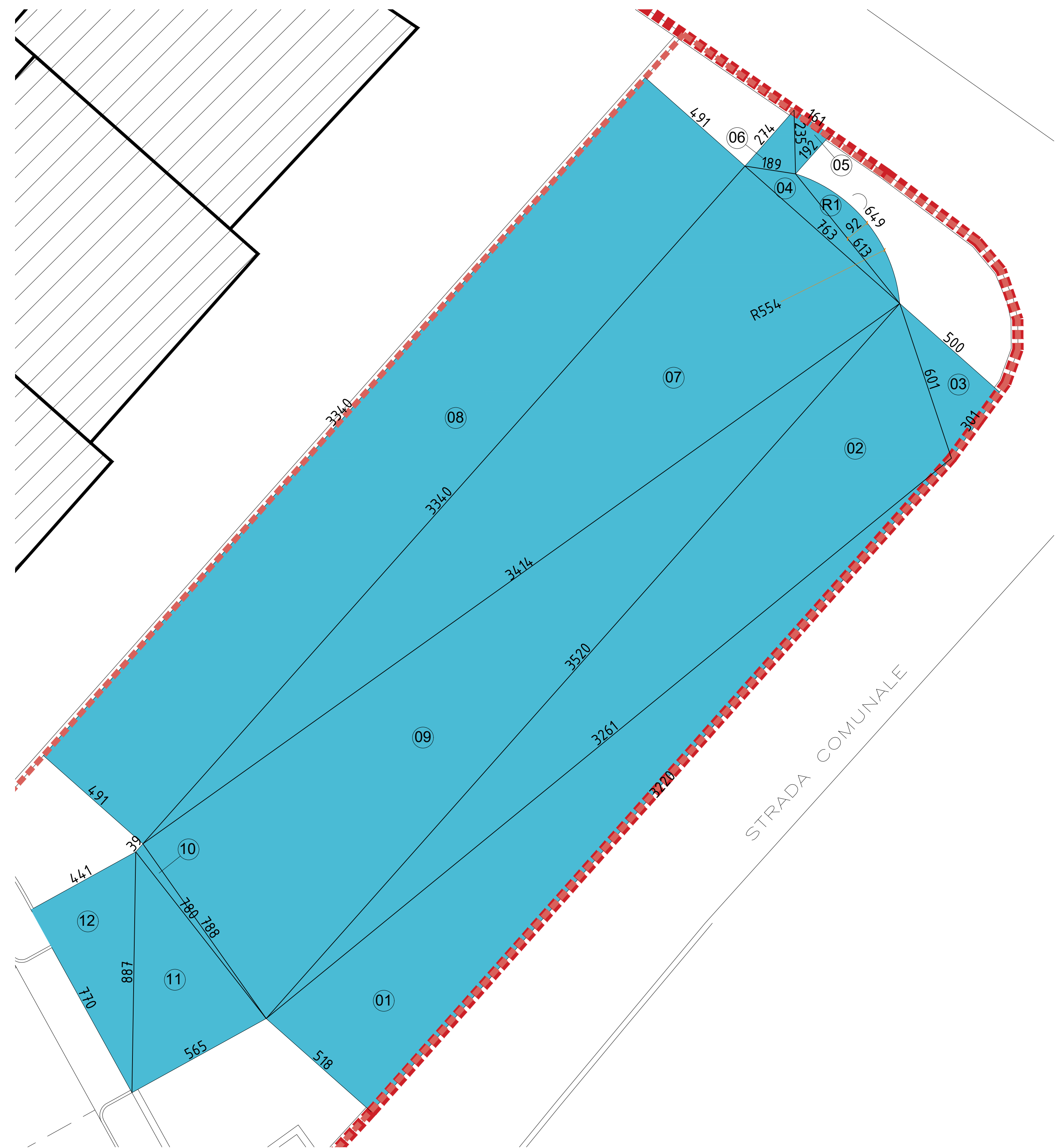
Dettaglio B 1:100