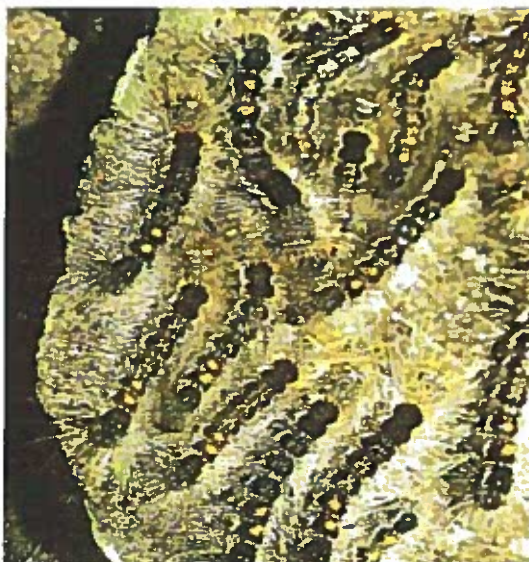
Giovani larve di E. Chrysorrhoea

Danni: le larve nascono e divengono attive nel pieno dell'estate, dalla fine di luglio alla metà di agosto. Hanno colore bruno nerastro, sono dotate di setole biancobruno (dalle proprietà urticanti) e sul dorso sono provviste di tubercoli color arancio. Ai lati del corpo si notano delle striature longitudinali bianco - arancio. Le larve manifestano tendenze gregarie. Le foglie delle piante ospiti (quercia, tiglio, acero, pioppo, carpino, rosacee e fruttifere varie) vengono ridotte alla sola nervatura. L'attacco determina dunque diffuse defogliazioni delle specie vegetali attaccate, che subiscono indebolimento e predisposizione ad altre malattie. Le modalità di lotta sono analoghe a quelle per Hyphantria Cunea .